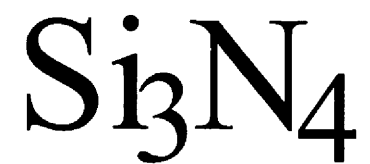
Fig. 1 Chemical structure of silicone nitride